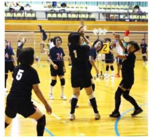
各コート ネット際の攻防戦～羽根の行方は？