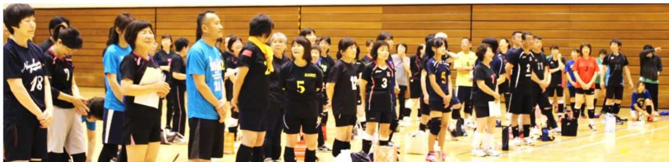
全員集合 《開会式》 行います

令和元年7月28日(日)8年ぶりに第20回 東部ブロックレクリエーション大会が蓮田市パルシーで行われました。参加チームは22チームと少なかったですが、和気あいあいと冷房の効いた中、ゆっくりと久しぶりの大会を楽しんでいました。