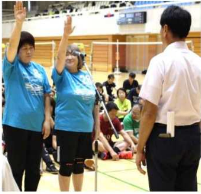
交流宣言「にこにこ」

9月22日(日)久喜市総合体育館において第21回シニア大会が45チーム227名の参加により盛大に行われました。