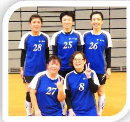
女子 優勝 ザ・イーズ