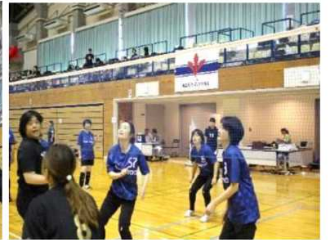
プレーもガンバル!