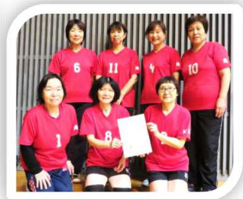
スーパーシニア女子 優勝 あじさい