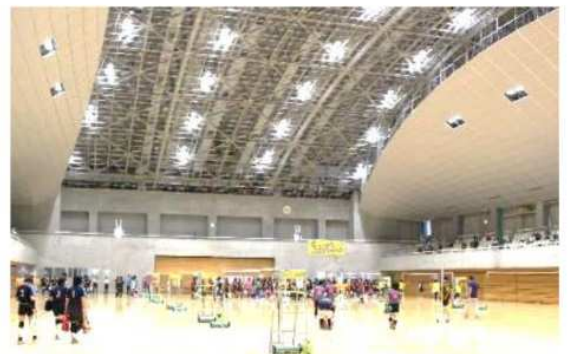
久喜市総合体育館