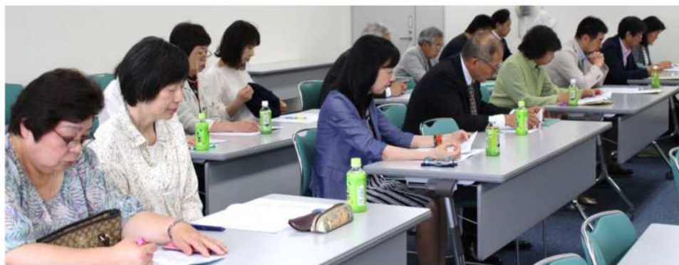
評議員、貴重なお意見ありがとうございました