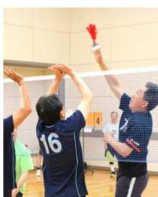
力強く迫力ある男子の試合でした