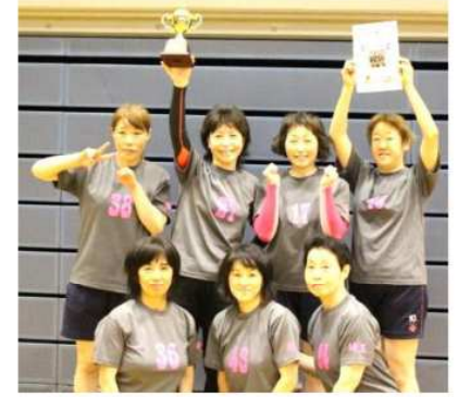
シニア女子 優勝 びたみんG