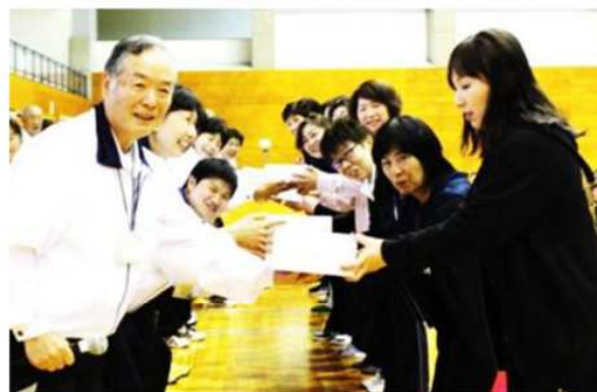
優勝おめでとうございます