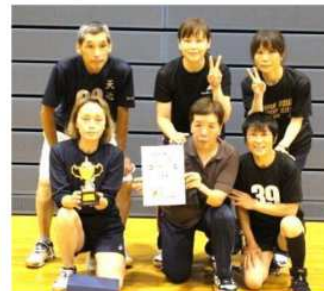
シニア女子準優勝 天元