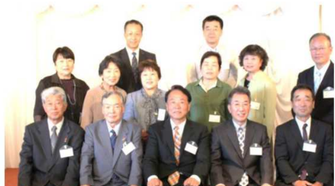
北部ブロックの皆さん