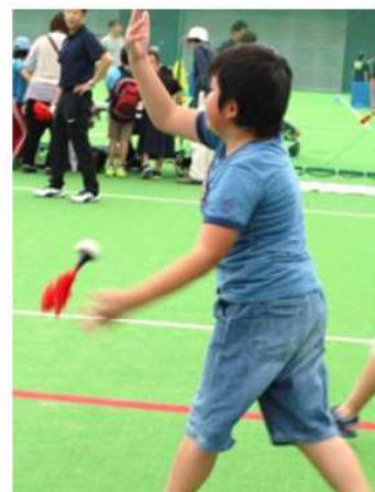
インディアカ体験コーナー