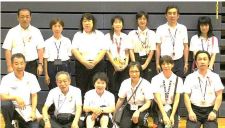
スタッフ 指導審判員の皆さんご苦労様です。