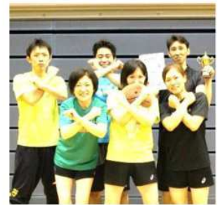
男女混合第3位 ひまわりT