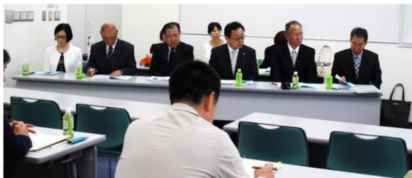
役員さんよろしくお願ひします

5月6日(日)さいたま市ソニックシティビル 905 研修室において、第 38 回評議員会が開催されました。評議員 18 名(委任状 2 名)の出席を得て、29 年度の事業報告、決算報告、また、30 年度の事業計画(案)、予算(案)が各専門部長、委員長より提案され原案通り承認されました。また、評議員から前年度比に対し、予算額が大幅に削減されたことへの経過質問、及び普及実行委員会による「体験学習」の内容等について活発な意見交換がなされましたが、無事終了し、平成 30 年度のスタートとなりました。