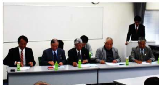
会長・副会長・相談役・監事 書記・司会