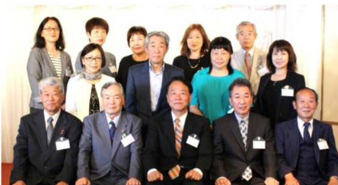
南部ブロックの皆さん