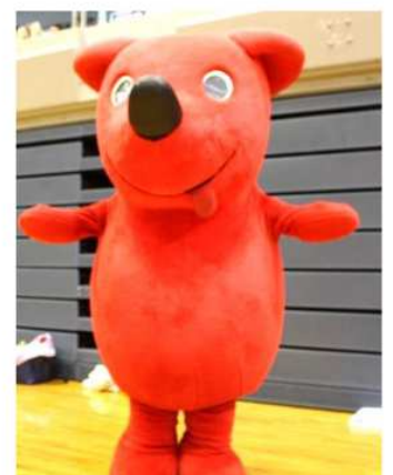
チーバ君です 埼玉県勢頑張りました