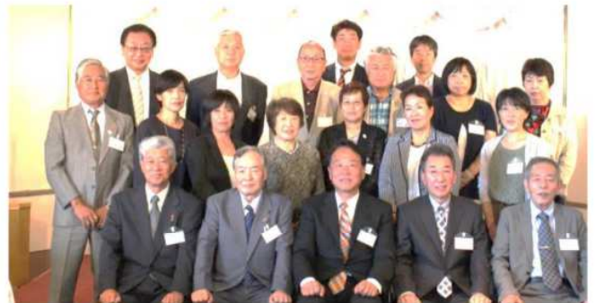
西部ブロックの皆さん