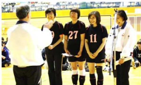
楽しい交流宣言でした

5月13日桶川サンアリーナにおいて、第15回オール埼玉レディース大会と第8回男子大会が、女子60チーム、男子14チーム、約367名の参加で行われました。メイン会場は女子チームだけのにぎやかな試合、サブ会場は男子チームだけの力強い試合でした。今年度最初の大会ですが、怪我もなく楽しい1日でした。普及男子では新潟より2チームの参加がありました。