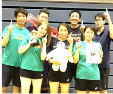
男女混合 優勝 ひまわりN