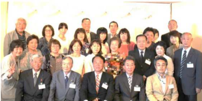
東部ブロックの皆さん