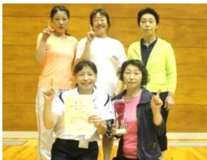
シニア女子・優勝 びたみんG