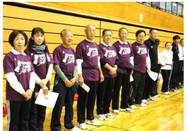
スタッフの皆さんご苦労様でした