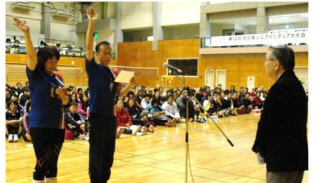
選手宣誓「とんぼブルー」