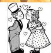
こんな時もあった？