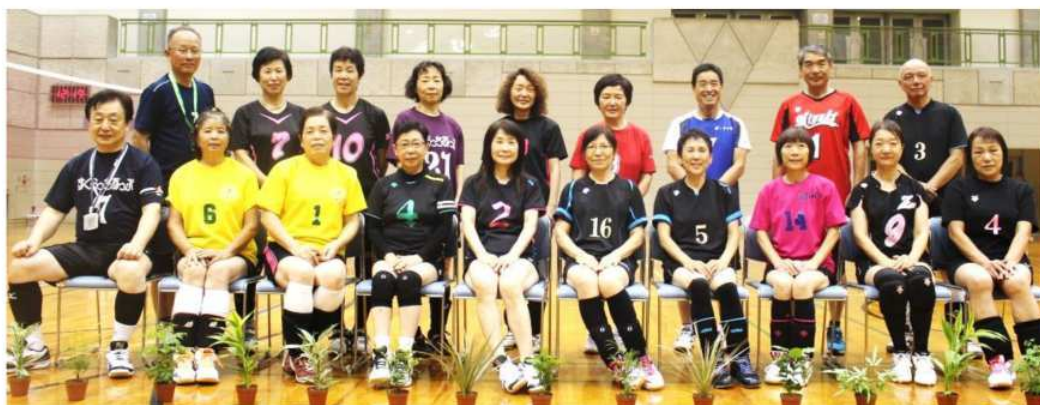
まだまだ若い人達にはまけないよ。65歳気合だ～