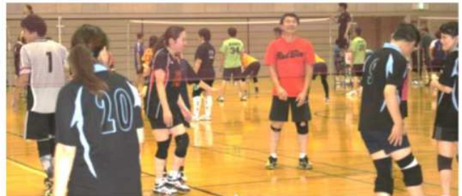
あら～いやだ 真ん中に落ちちゃった