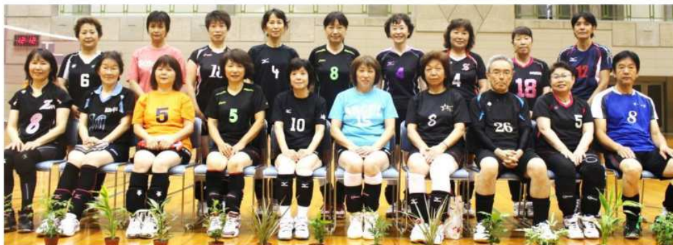
60歳になっちゃいました。よろしくです。

9月24日(日)お彼岸の最中に、幸手市総合体育館において埼玉県シニア大会が行われ、シニアとは思えない熱戦が繰り広げられました。そして今年新たな表彰規定で60歳・65歳・70歳・75歳が長年現役プレーヤーとしての「輝く人賞」を表彰されて、今後もプレーを継続していくことを望み誓いありました。