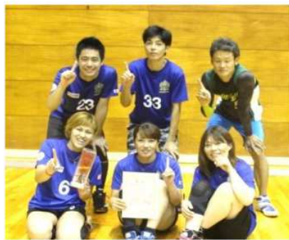
男女混合・優勝 ひまわり