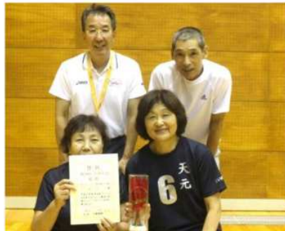
スーパーシニア混合・優勝 天元