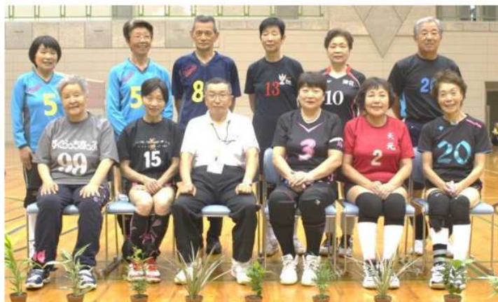
まだまだいける 70歳・75歳