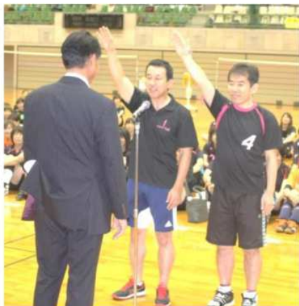
シャトルランナーズ ユニークな選手宣誓で 選手も来賓も大拍手

9月24日(日)お彼岸の最中に、幸手市総合体育館において埼玉県シニア大会が行われ、シニアとは思えない熱戦が繰り広げられました。そして今年新たな表彰規定で60歳・65歳・70歳・75歳が長年現役プレーヤーとしての「輝く人賞」を表彰されて、今後もプレーを継続していくことを望み誓いありました。