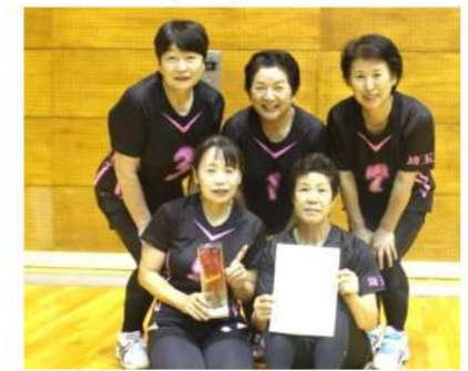
スーパーシニア女子・優勝 ブルーエンジェル