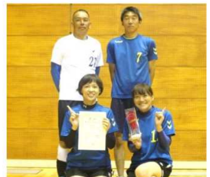
シニア男女混合・優勝 ナイン