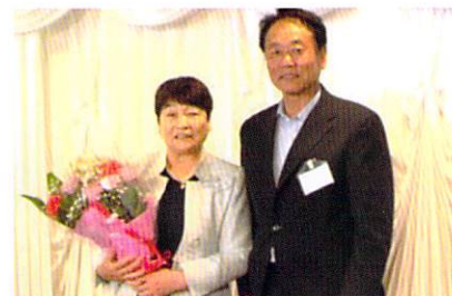
平成 29・30 年度ブロック長