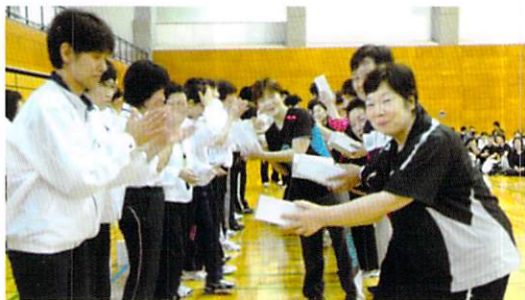
優勝おめでとうございます

5月14日桶川市サンアリーナにおいて、第14回オール埼玉レディース大会と第7回普及活動男子大会が、女子63チーム、男子15チーム、約380数名の参加で行われました。メイン会場は女子チームだけの華やかな試合、サブ会場は男子チームだけの力強い試合でした。今年度最初の大会ですが、これから来年の2月まで数回の大会が行なわれますので、多くのチームの参加を期待しております。スタッフの皆さんお疲れ様でした。