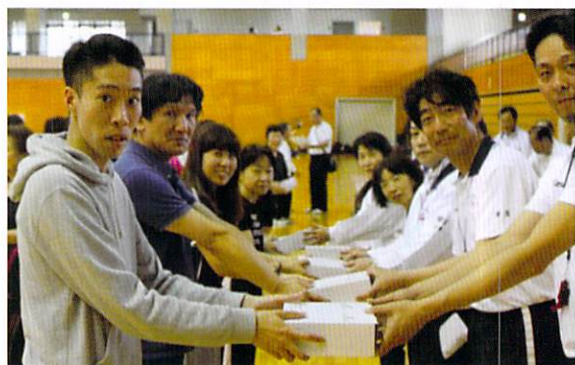
大活躍おめでとうございます