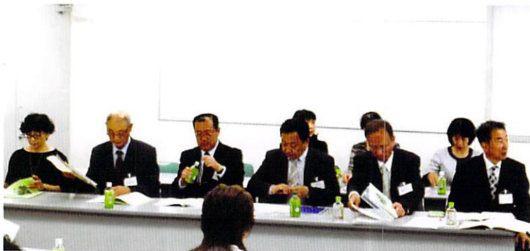
新役員さんよろしくお願ひします

5月7日(日)さいたま市ソニックシティビル 905 研修室において、第 37 回評議員会が、開催されました。評議員 15 名(委任状 4 名)の出席を得て、28 年度の事業報告、決算報告、また、29 年度の事業計画(案)、予算(案)が各専門部長、委員長より提案され原案通り承認されました。また、評議員から前年度に対し予算額が大幅に削減されたことへの質問、及び競技服の番号表示位置等について活発な意見交換がなされました、新役員も気持ちを新たに 29 年度のスタートとなりました。