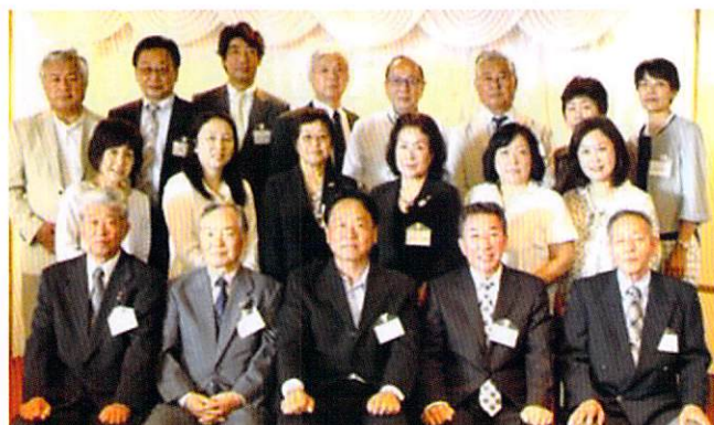
西部ブロックの皆さん