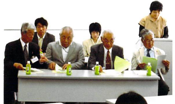
顧問・相談役・監事 書記・司会