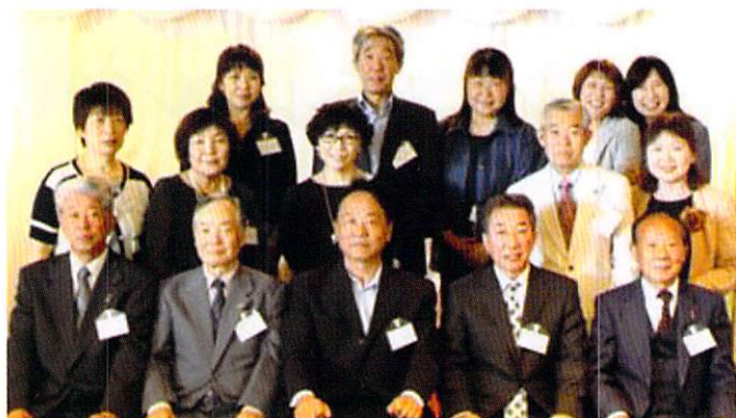
南部ブロックの皆さん