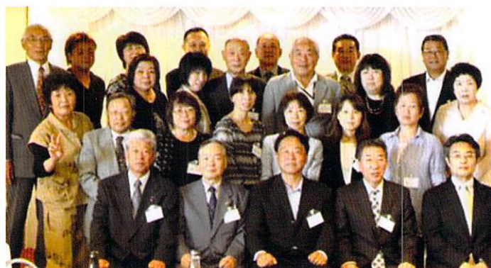
東部ブロックの皆さん