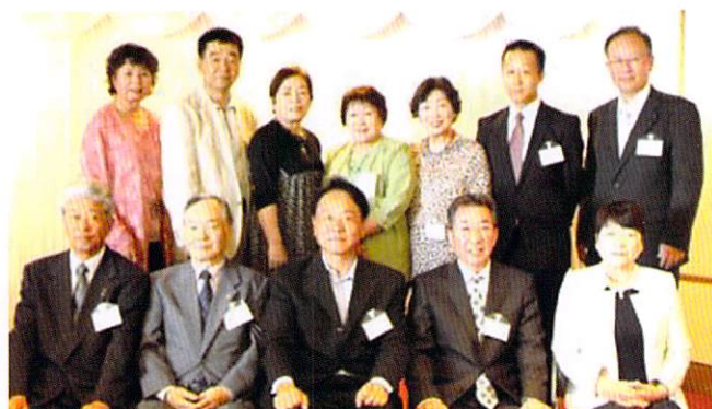
北部ブロックの皆さん