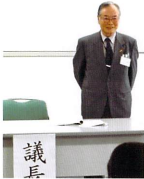
議長 お疲れ様でした

5月7日(日)さいたま市ソニックシティビル 905 研修室において、第 37 回評議員会が、開催されました。評議員 15 名(委任状 4 名)の出席を得て、28 年度の事業報告、決算報告、また、29 年度の事業計画(案)、予算(案)が各専門部長、委員長より提案され原案通り承認されました。また、評議員から前年度に対し予算額が大幅に削減されたことへの質問、及び競技服の番号表示位置等について活発な意見交換がなされました、新役員も気持ちを新たに 29 年度のスタートとなりました。