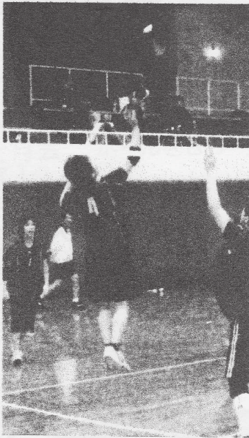
華麗なるジャンプトス