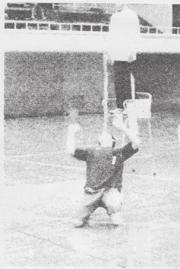
男子ならではの? 低い位置でも、しゃがんでトス