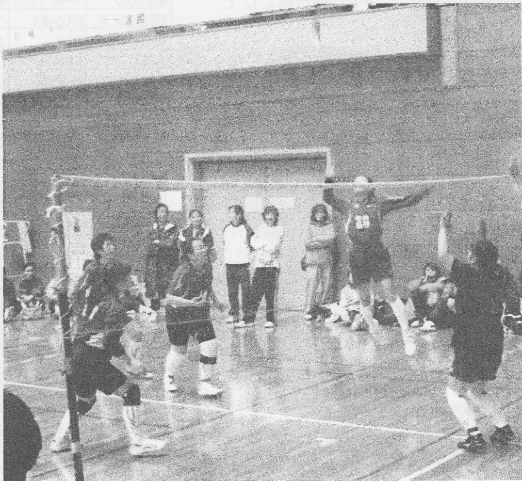
女子決勝戦 〈ザ・イーズ 対 HAYATE〉