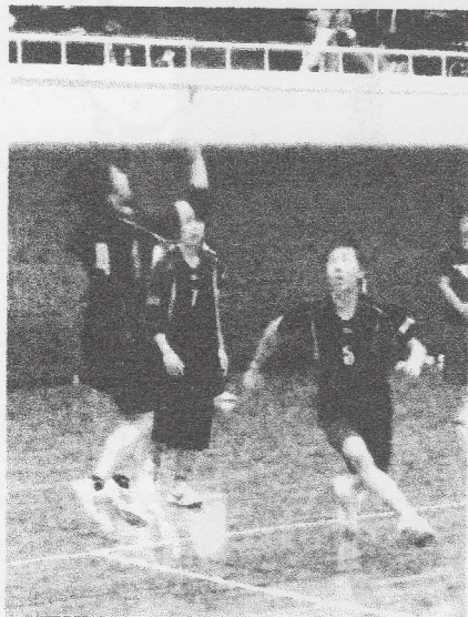
ジャンプトスから 速攻へ