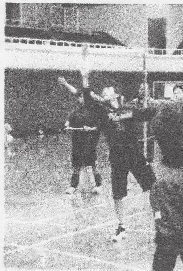
ネット際も腕だけで