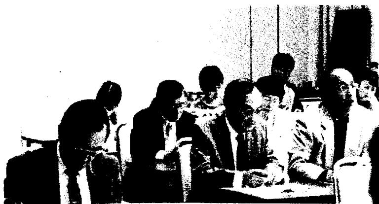
評議員席からも活発な意見がだされました。