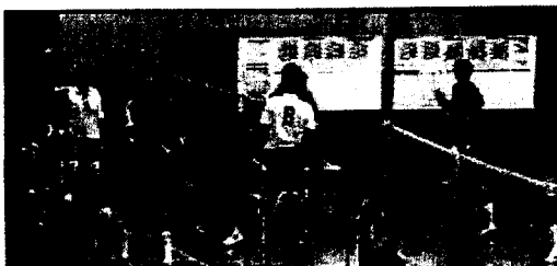
楽しく試合が出来たとの感想を頂いた大会でした