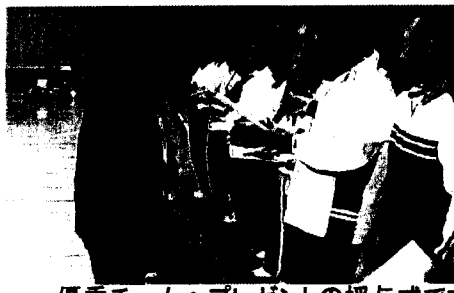
優秀チームへプレゼントの授与式です。