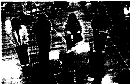
激戦のあとは楽しみの賞品をプレゼント頂きました