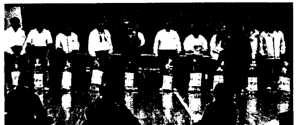
特別賞には地元名産深谷ネギのお土産を用意しました