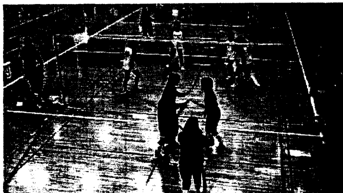
岩槻区で開催された交流大会に参加しました。