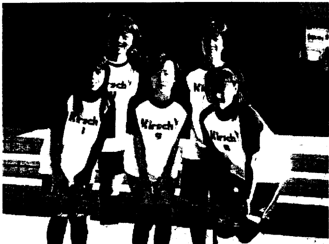
5人組キルシュです。ヨロシクね！