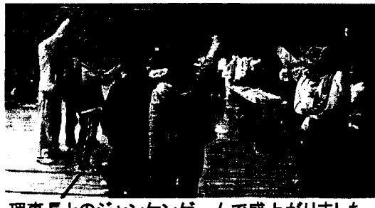
理事長とのジャンケンゲームで盛り上がりました。