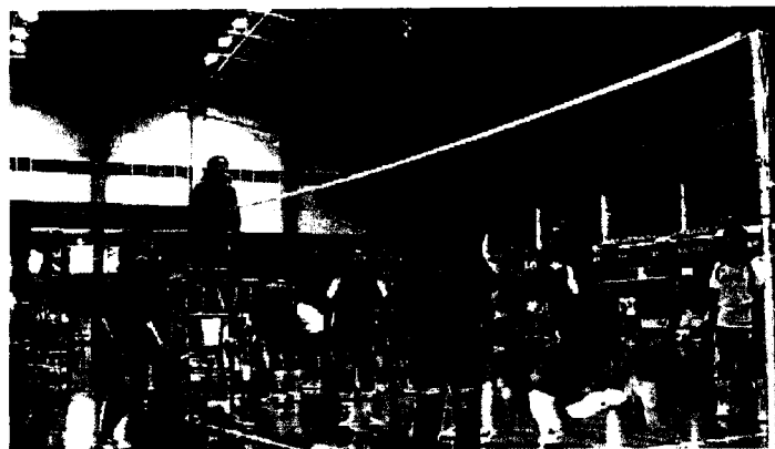
笑顔の出逢いで花がいっぱい咲いた大会となりました