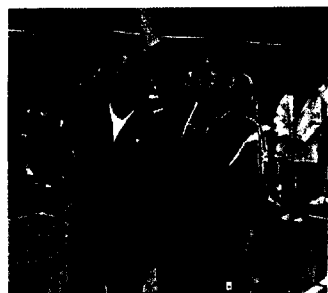
立派な選手宣誓でした。