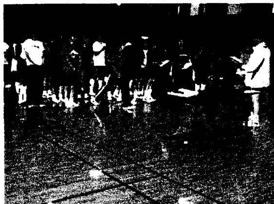
疲れた様子もなく認定証の授与式です。