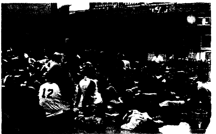
最後はクールダウンで身体の疲れをとりましょう。