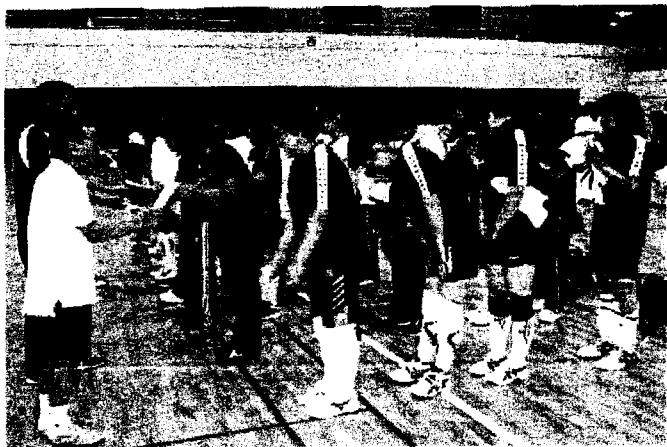
暑さ対策も万全でしたね。(認定証授与式です)