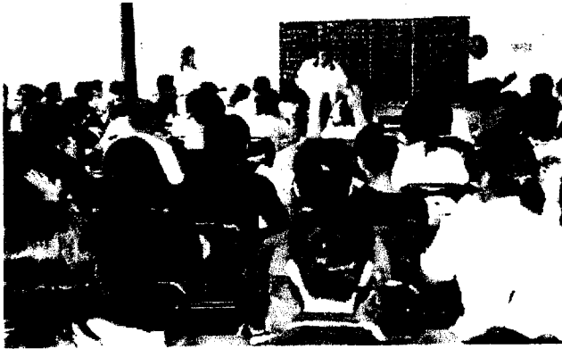
教室は受講生の熱気でムンムンでした。

キューポラのある町川口市にて普及審判認定講習会が7月10(日)に緑に囲まれた神根公民館会場で開催されました。当日は朝からギンギラギンの真夏日になり受講者も汗ビッシュヨリになりながら午前の実技講習に取り組んでいました。午後は昼食後にインディアカ競技規則の講習時間でしたが、川口市の会長を始めとして約80数名が合格を目指して頑張りました。大変お疲れ様でした。きっと全員が合格ですよ。