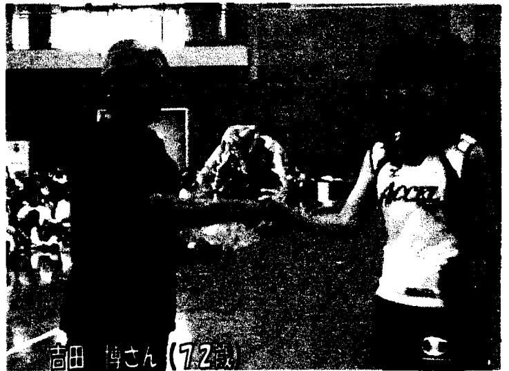
この若さ、プレー振りは後輩のよいお手本です。川越市(南大塚S・I)