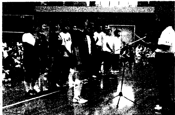
一番頑張ったチームの試合後の優勝チーム表彰式です。