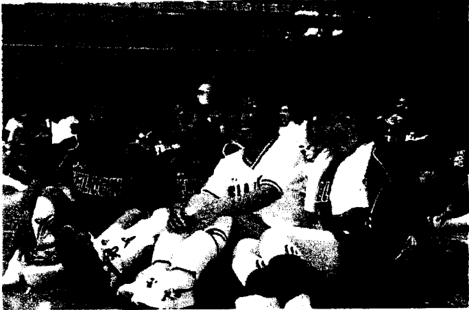
激しい戦いの後のホットした休息風景です。