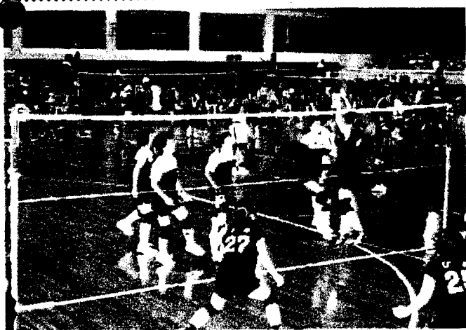
最終ゲームまでもつれた厳しい試合だったようです。