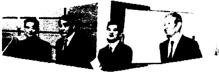
来賓の皆様方有がとう御座いました。

第十四回中央大会は選手、役員及び関係者のご協力で素晴らしい大会になり広報部員も取材に力が入り過ぎたかなと反省しています、最後にご協力頂きました皆様方ありがとうございます。御座いました。