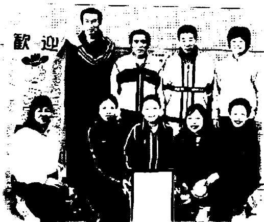
ザ・イーズ皆さんお疲れ様でした。