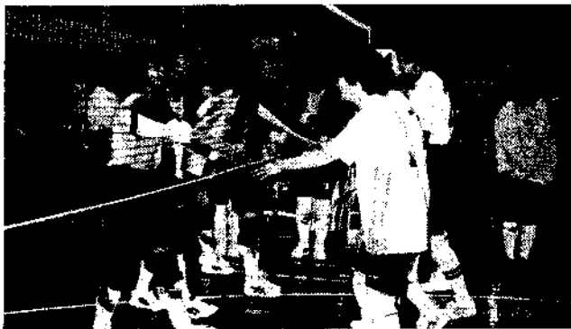
H11. 2. 21 草加市健康都市記念体育館